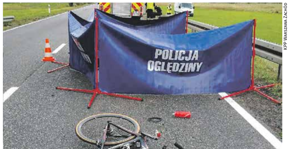
KPP WARSZAWA ZACHÓD

Do zdarzenia doszło 8 sierpnia około godz. 14.00 doszło do wypadku drogowego z udziałem rowerzystki i kierującego mercedesem. Obrażenia kobiety były tak duże, że mimo podjętej reanimacji, zmarła na miejscu. Śledztwo w tej sprawie prowadzi grodziska prokuratura. - Świadców tego wypadku oraz osoby mogące przyczynić się do ustalenia okoliczności zdarzenia, w szczególności kierowca osobowego