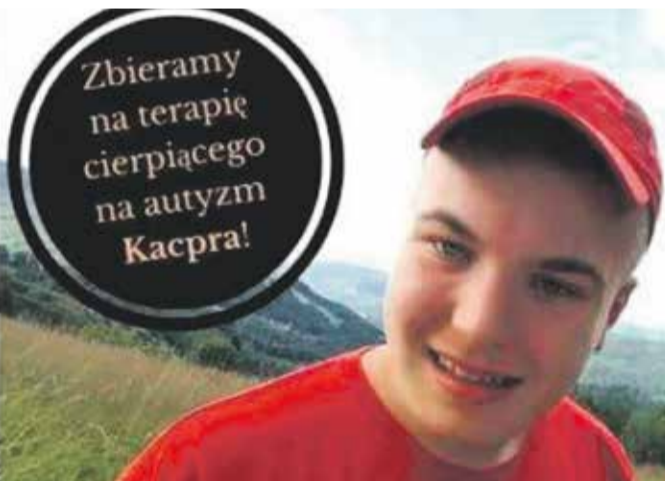
CENTRUM ZDROWIA DZIECKA

przewidzieliśmy na ten dzień koncerty zespołów znanych ze sceny muzycznej – zachęcają organizatorzy.