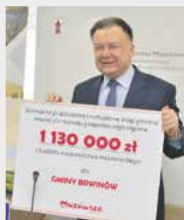
Brwinów otrzymał ponad milion zł wsparcia na rozbudowę drogi gminnej

Od 20 lat dbamy o rozwój Mazowsza. Przeznaczamy środki na drogi, szpitale, muzea, zabytki, boiska, place zabaw, OSP czy inwestycje w sołectwach. Przez te dwie dekady do powiatów pruszkowskiego i grodzkiego w sumie przekazaliśmy ponad miliard zł. W tym roku ruszyły też nasze autorskie, pilotażowe programy. Wsparcie kierujemy m.in. do sołectw na wyposażenie świetlic, zagospodarowanie skwerów, zakup strojów ludowych czy instalacje tawek solarnych. Nowością jest też program na remonty strażnic OSP. Od lat doposażamy i dofinansowujemy strażaków. Tym razem chcemy zapewnić im komfortowe i bezpieczne warunki w ich miejscach pracy. Dbamy też o nasze mazowieckie zabytki. Pieniądze z naszego budżetu pozwolą m.in. zrewitalizować pałac w Brwinowie oraz dworek w Żabiej Woli.