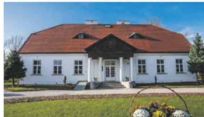
Dzięki środkom z budżetu województwa dworek w Żabiej Woli przejdzie renowację