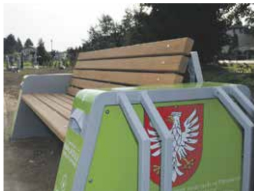
W Nadarzynie, dzięki wsparciu sejmiku Mazowsza, zamontowano ławki solarne. Można za ich pośrednictwem m.in. naładować telefon i skorzystać z darmowego wi-fi

Mazowieccy strażacy ochotnicy przy pomocy środków z budżetu Mazowsza wyremontują strażnice – wymienią dach, okna, a także instalację elektryczną. Na ten cel samorząd województwa przeznaczył 5 mln zł . Środki pozwolą zrealizować 214 przedsięwzięć w całym regionie. Z pomocy skorzystają OSP – Raszyn, Piastów, Nadarzyn, Brwinów, Jaktorów, Boża Wola i Milanówek. W sumie jednostki otrzymały ponad 152 tys. zł .